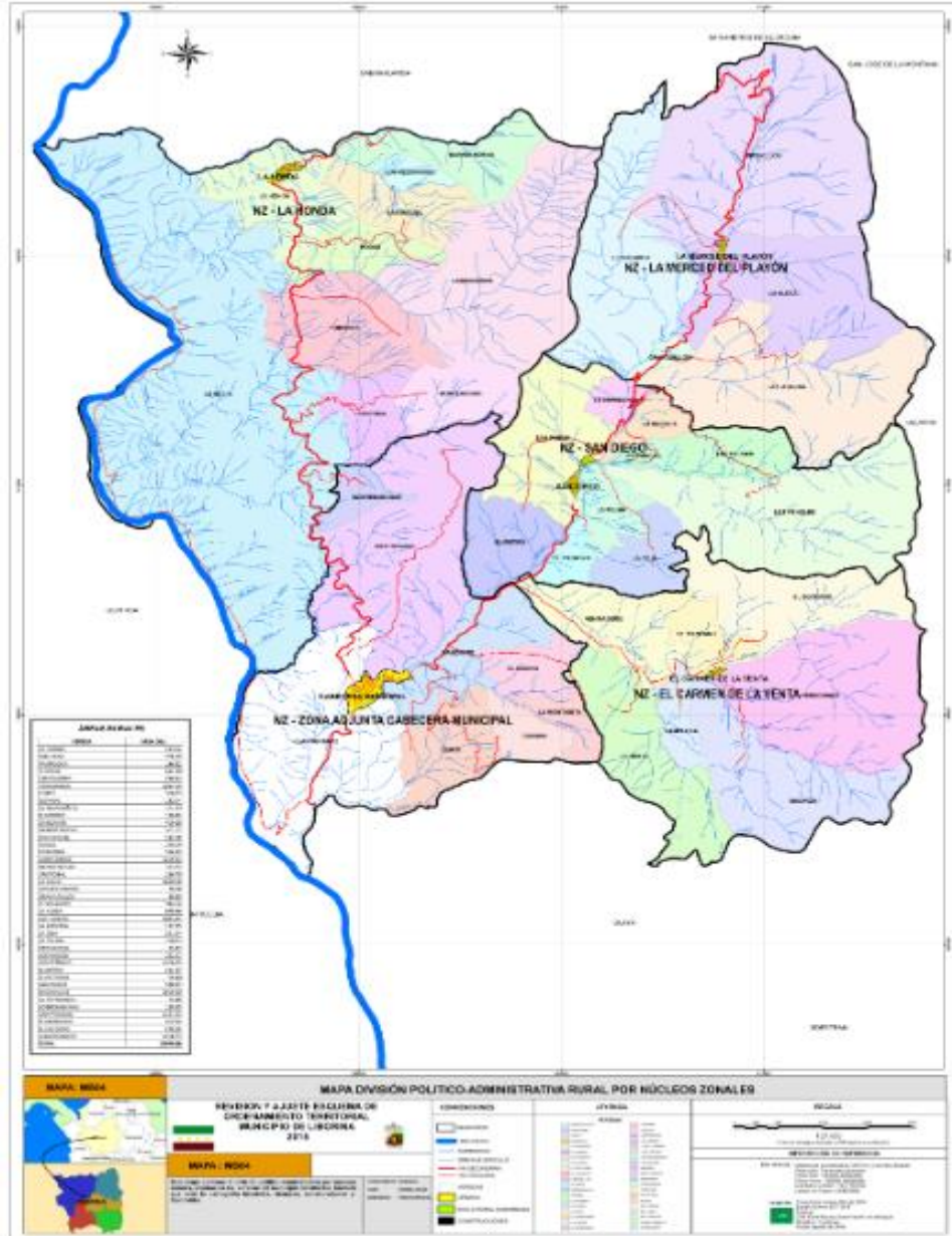
División Política Administrativa Municipio de Liborina Antioquia