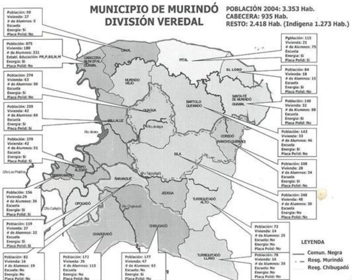
Ilustración 2: División Política Administrativa del Municipio de Murindó, Antioquia – EOT Municipal

El Municipio de Murindó – Antioquia, en cuanto a su división política administrativa está conformado por 3 corregimientos y 17 veredas.