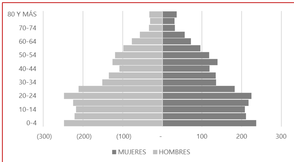
Ilustración 8: Pirámide poblacional. Fuente DANE municipio de Murindó 2015

El grafico indica que en el municipio de Murindó en el año 2015 la población estaba distribuida según sexo en un 50.28% Mujeres con 1186 y en un 49.72% Hombres con 1489.