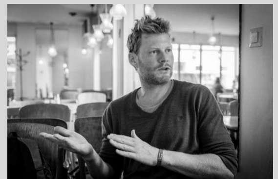
Christian Felber ha impulsado la llamada economía del bien común, se orienta a la maximización del bienestar de nuestra sociedad

El modelo económico implica poder medir el impacto económico y ambiental que genera la empresa a sus grupos de interés, analizando cuatro valores básicos: dignidad humana, solidaridad y justicia social, sostenibilidad económica y transparencia y participación democrática.