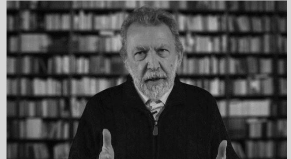
Luis Razeto uno de los principales exponentes latinoamericanos del concepto de Economía Solidaria. Ha planteado la economía solidaria como respuesta real y actual a las problemáticas sociales de nuestros tiempos.